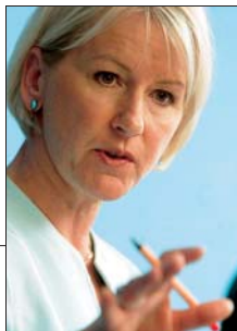
WALLSTRÖM Einwände der USA

Außerdem müssten Auslands-töchter von Chemieunternehmen solche Stoffe, die ihre Muttergesellschaften bereits gemeldet haben, erneut registrieren. Nach Ansicht der USA ist dieses System nicht praktikabel und verstößt gegen die Handelsgepflogenheiten. TT